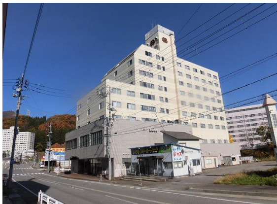
エンゼルリゾート湯沢外観