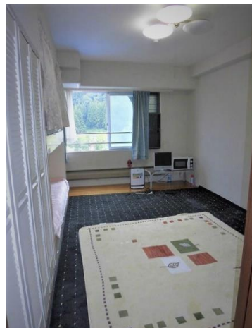
和室 約7.5帖の洋室使い