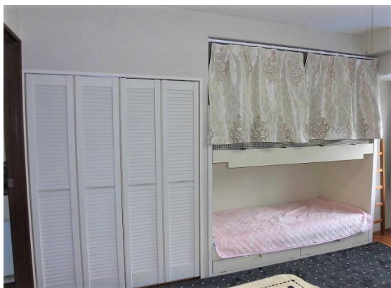
物入 + 2段ベッド